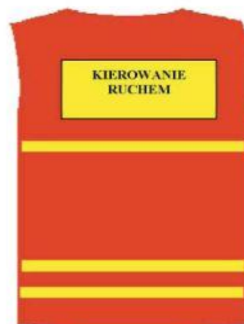
Narzutka — tył