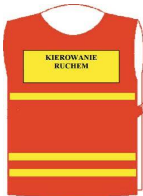
Narzutka — przód